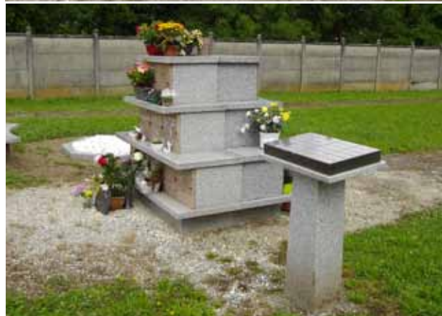
Le Columbarium de la commune