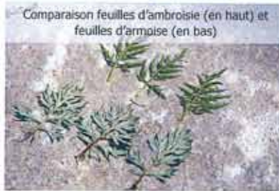
Comparaison feuilles d'ambroisie (en haut) et feuilles d'armoise (en bas)