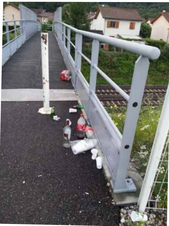
Ordures sauvages devant les écoles et sur la passerelle SNCF permettant l'accès au lotissement Clos du Manoir - photo Juin 2015