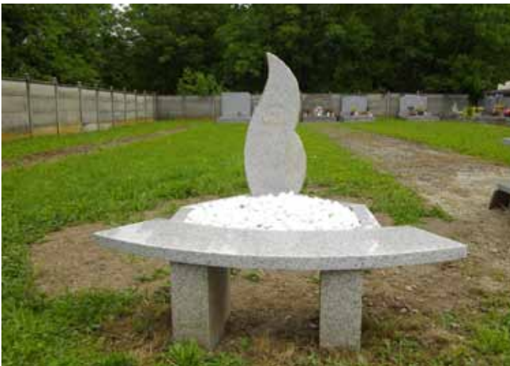
Le jardin du souvenir

La reprise des tombes abandonnées se poursuit, et la réalisation d'un ossuaire est en projet.