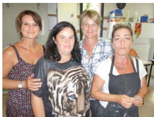
▲ L'équipe d'ATSEM