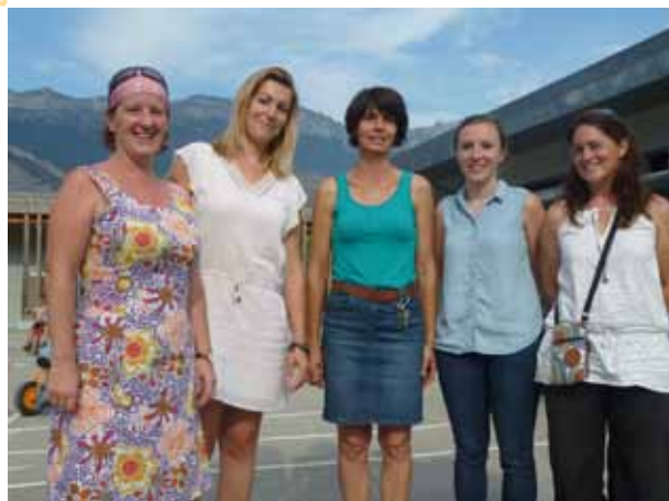
▲ L'équipe d'enseignantes en Maternelle