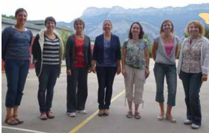
▲ L'équipe d'enseignantes en Primaire