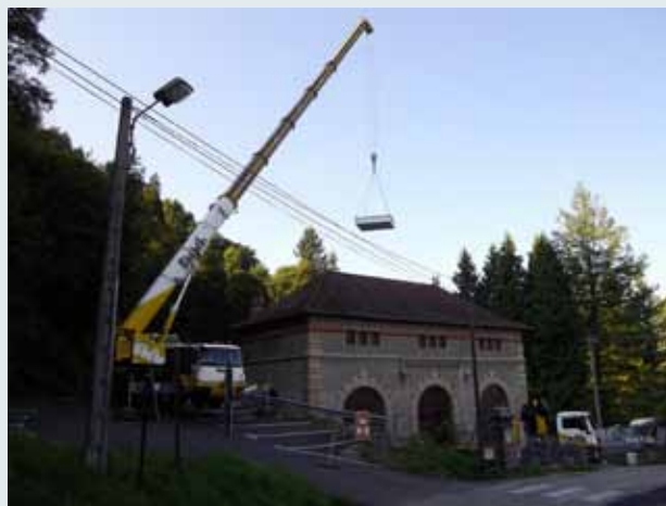
- Les turbines de la centrale hydroélectrique datant du début du siècle dernier ont été remplacées dernièrement.