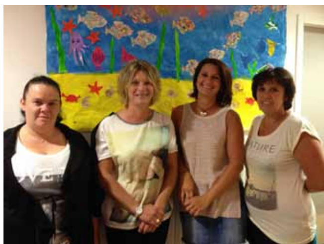
Équipe des ATSEM