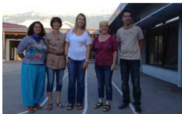
Équipe des enseignants de maternelle