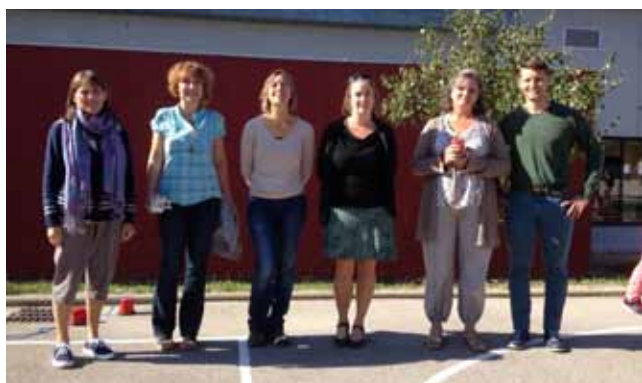
Équipe des enseignants de primaire