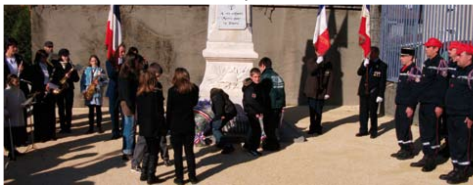
Cérémonie du 11 novembre, le CME rend hommage aux résistants.