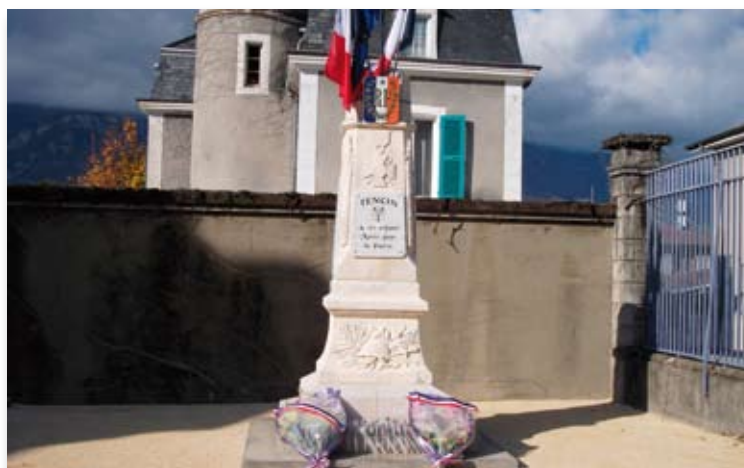
Monument aux morts