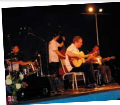
NUAGES DE SWING