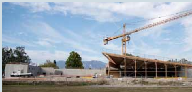
Chantier Centre nautique à Pontcharra

Pour ce deuxième site, le coût total des travaux se monte à 3,24 millions d'euros.