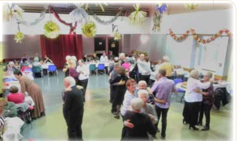
Repas des anciens 2018