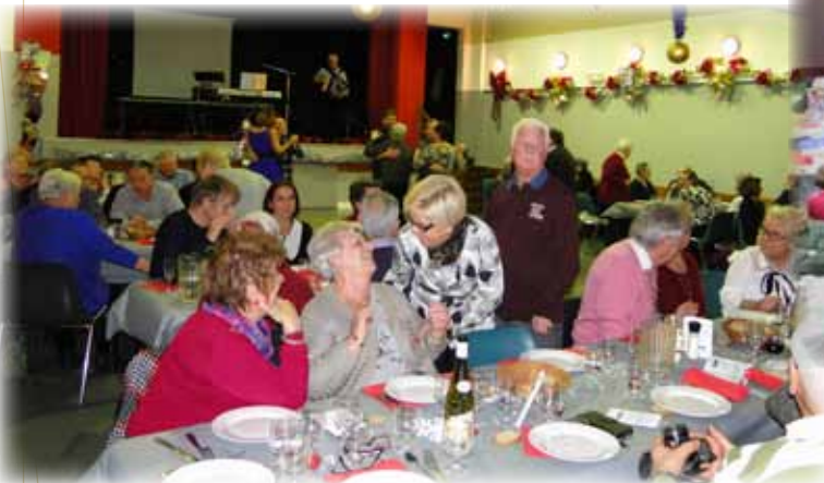
Repas des anciens 2017