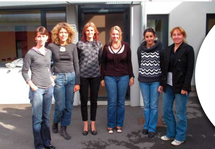
Équipe éducative de l'école primaire.

Cette année, 159 enfants ont fait leur rentrée le 2 septembre.