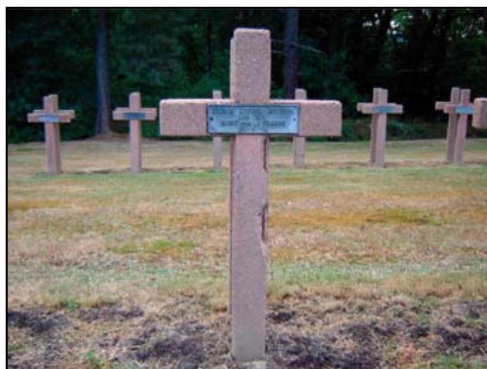
Lucien Auguste GENIN, soldat tombé aux combats pendant la première guerre mondiale.

verser de nombreux champs de bataille et lieux de mémoires où elle a retrouvé plus de quatre-vingt tombes de nos soldats. Une occasion pour tous de découvrir les parcours de nos valeureux