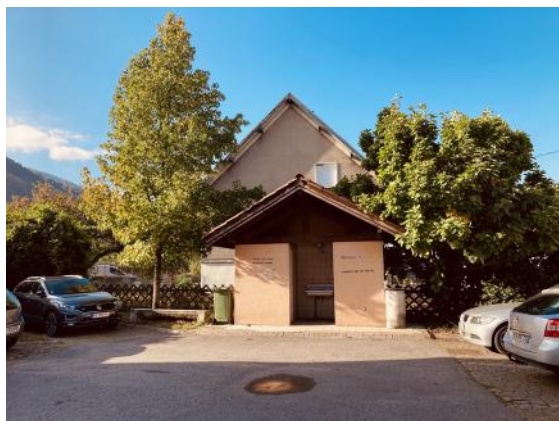
Photos prises lors de divers visites de site