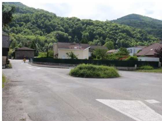
Photos prises lors de divers visites de site